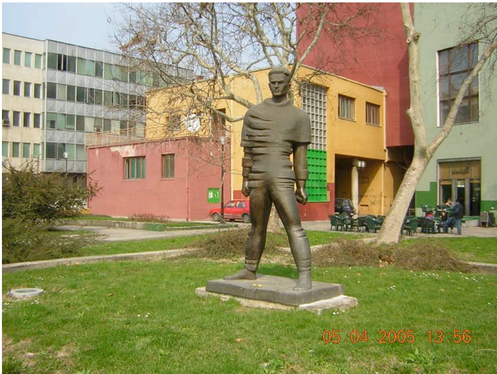
Прилог 6: споменик Жикици Јовановићу