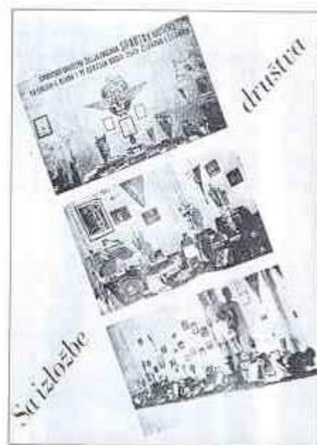
Прилог 4. Плакат поводом изложбе за прославу петогодишњице од оснивања друштва 1950. године. 49

На годишњој скупштини физкултурних организација, које су одржане у целој земљи, наглашено је да у току 1950. године, велики део материјалне помоћи народне власти и осталих прихода расипнички потрошен. Новац је трошен на разне банкете, логоровање спортиста, путовања чланова спортских организација. Такође, велик број спортских друштава завршио је 1950. годину са неуравнотеженим буџетом и великим дуговима. Спортске организације нису водиле бригу приликом употребе игралишта, терена и справа. Справе су се често чувале под ведрим небом, што је био главни узрок њиховог пропадања, док су се терени користили без реда и распореда, па је на њима долазило до оштећења. Реквизити као што су копља, кугле, дискови, нису се чували под кључем па је било честих крађа. 50