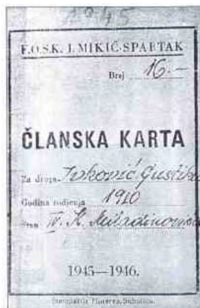
Прилог 11. Пример чланске карте 8