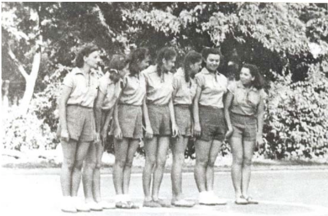
Прилог 14. Женски кошаркашки тим Спартака из 1950. године 11