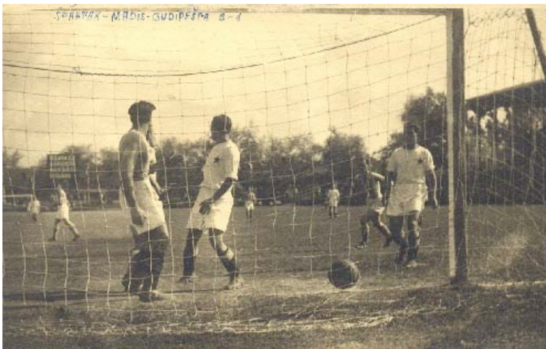
Прилог 2. Детаљ са утакмице Спартак – Мадис, 1945. године. 16