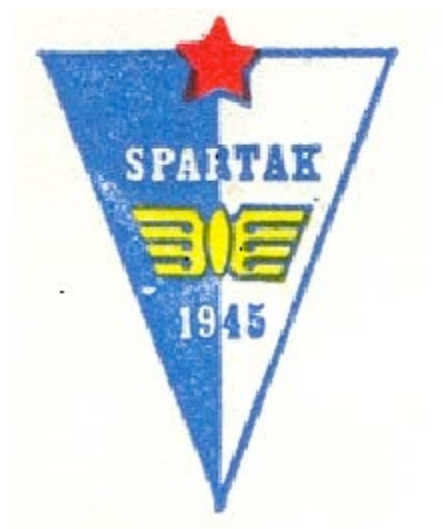
Прилог 10. Грб Спартака 7